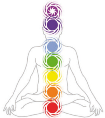
Human Healing Stones Initialmessung: 11.11.2012 15:28:38